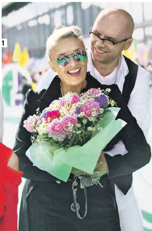
1 С Андреем Латковским Лайма Вайкуле познакомилась еще в 1970 году. Уже 36 лет они живут вместе 2 Даже в свои 60 Лайма выглядит прекрасно, хотя уверяет, что никогда не прибегала к услугам пластических хирургов.

Совесть для меня — святое. Могу пожертвовать чем угодно, но останусь при этом принципиальной. Я не смогу жить дальше, если в угоду кому-то или чему-то пойду наговор с совестью. Но ведь таким тяжело жить, особенно в шоу-бизнесе? Согласна. Зато ты растешь в своих глазах и обретаешь уверенность в себе. Помню, еще девочкой я осуждала