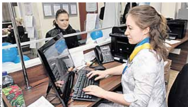
Бояться перемен в законодательстве москвичам, получающим социальные услуги, не стоит